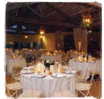
La salle Vieux Languedoc 500 m 2