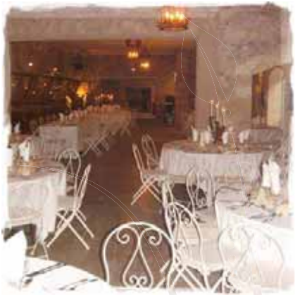
La salle des Templiers 430 m 2

Pour que vos événements soient inoublables.