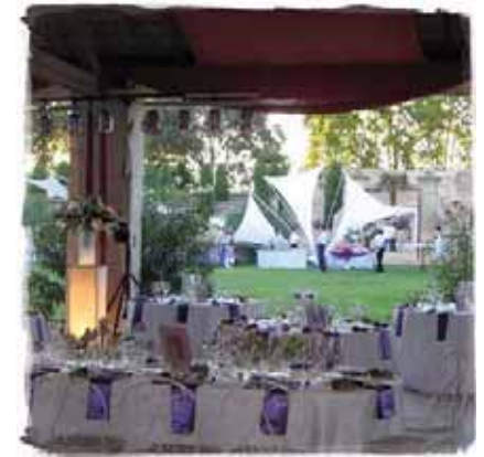
La salle Vieux Languedoc